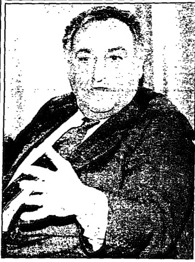
سانفورد (ساندي) فاول كبير المسؤولين التنفيذيين لشركة تارايزن غروب الأمريكية التي انضمت مؤخرا مع صوف ستري كورب. وقد حصل ساندي خلال الأسابيع الثلاثة الماضية على أكثر من 236 مليون دولار كراتب وملاوات على الأمد

طهران-رويترز: قالت صحيفة (رسالت) الإيرانية أمس الأربعاء إن معدل التضخم في إيران انخفض إلى 17 في المئة في شهر مارس. وقالت الصحيفة إن معدل التضخم في إيران انخفض إلى 17 في المئة في شهر مارس. وقالت الصحيفة إن معدل التضخم في إيران انخفض إلى 17 في المئة في شهر مارس.